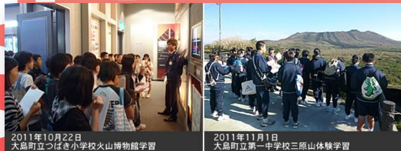
2011年10月22日 大島町立つばき小学校火山博物館学習